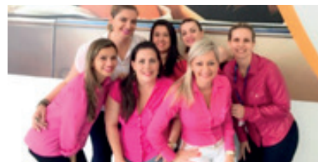
Equipe da associada SulAmérica Seguros - Florianópolis.

Em 2015, os números levantados com as associadas do SindsegSC foram: 58 escritórios em oito cidades do estado, 545 colaboradores, sendo 303 mulheres e 242 homens, sendo que desses, 47 homens atuam como gestor e 11 mulheres como gestoras de filiais.