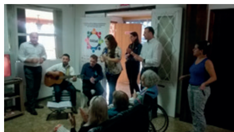
Equipe do GT de Joinville visitando o Asilo Lar Aconchego, no dia 23/11/2015.

A Campanha de Solidariedade de 2015 do SindsegSC teve uma proposta desafiadora aos profissionais das seguradoras associadas.