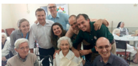
GT de Florianópolis visitando o Asilo Casa de Repouso Divina Providência, no dia 16/11/2015.

Iniciada no dia 05 de outubro, a Campanha Retribua um Sorriso teve como principal objetivo promover visitas aos asilos e levar um dia diferente aos idosos, pessoas que tanto precisam de carinho e atenção nessa fase da vida.