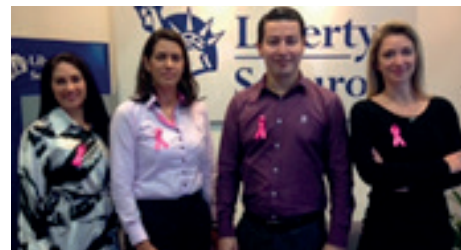
Equipe da associada Liberty Seguros - Joinville.