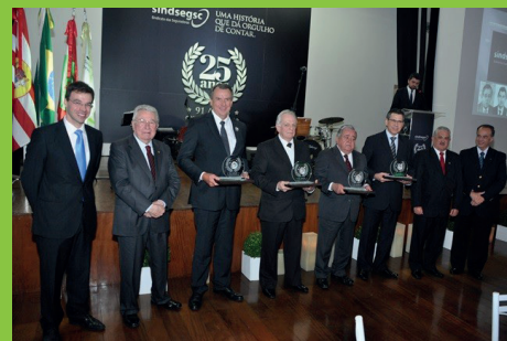
Homenagens aos presidentes das gestões anteriores.

No evento, os Coordenadores das Comissões e Grupos receberam das mãos de profis-