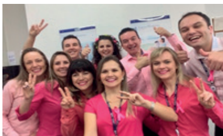
Equipe da associada Yasuda Marítima - Blumenau.

A qualidade de vida e a prevenção de doenças é o principal foco da campanha Eu Sou Vida - Outubro Rosa e Novembro Azul, trabalhada pelo SindsegSC no ano de 2015.