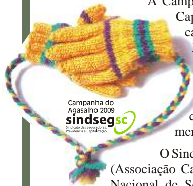
Campanha do Agasalho 2009 sindsegsc Sindicato das Seguradoras, Previdência e Capitalização

O SindsegSC contou com o apoio de suas associadas e da ACTS (Associação Catarinense Técnica de Seguros) e patrocínio da Escola Nacional de Seguros e do Sincor/SC (Sindicato dos Corretores de Seguros de Santa Catarina), que trabalharam juntos, na intenção de unir forças pelo bem estar social.