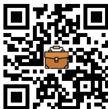
Oportunidades Talento Humano