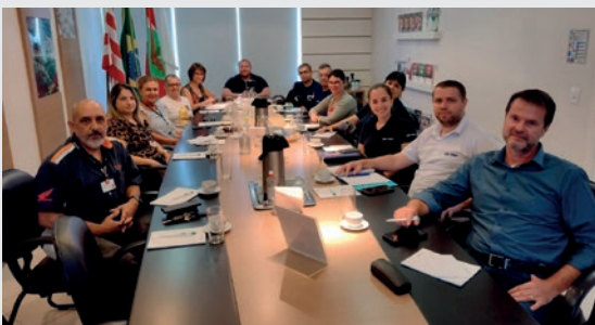
Reuniões: 23 de Abril de 2024