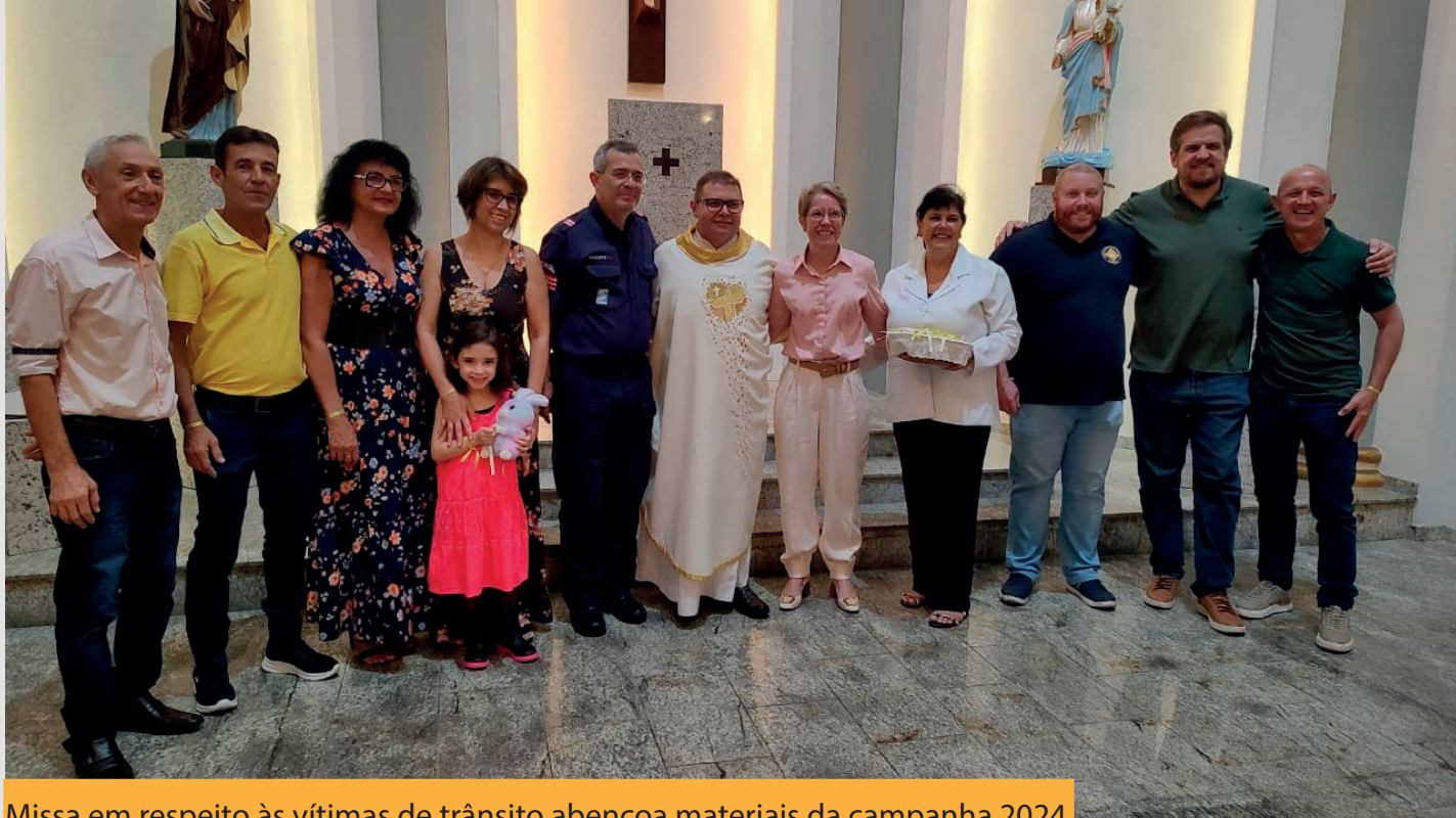
Missa em respeito às vítimas de trânsito abençoa materiais da campanha 2024

Uma missa em prol das vítimas de trânsito foi realizada no dia 5 de maio, na Paróquia Nossa Senhora da Glória, no bairro Garcia, em Blumenau.