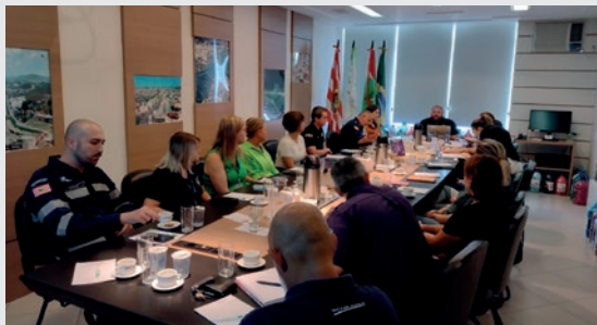
Reuniões: 10 de Abril de 2024