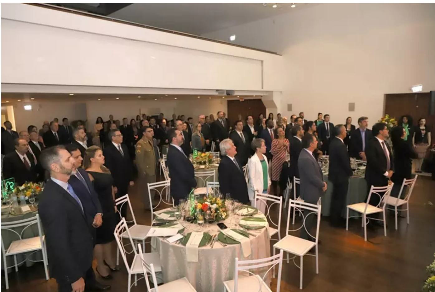
SindsegSC celebra 98 anos de fundação.

especial do presidente da CNseg Dyogo Oliveira .