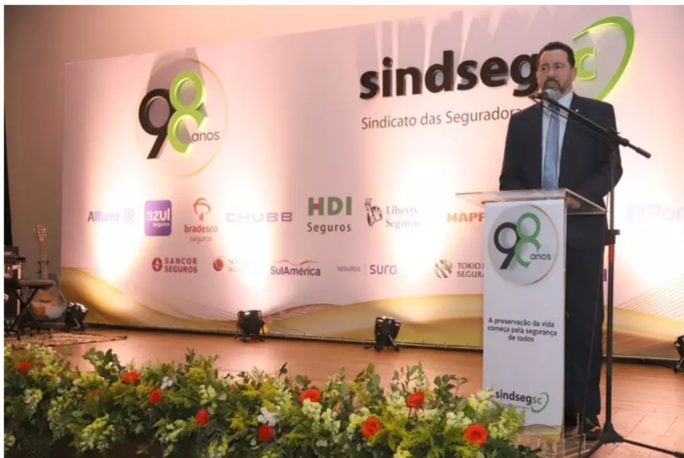
O Diretor Presidente da CNseg – Confederação Nacional das Empresas de Seguros Gerais, Previdência Privada e Vida, Saúde Suplementar e Capitalização Dyogo Oliveira.

Oliveira que é Economista e tem 20 anos dedicados a cargos executivos de governo, sendo os últimos: Ministro do Planejamento, Desenvolvimento e Gestão (maio 2016/abril 2018); Presidente do BNDES (abril 2018/dezembro 2018); Presidente da Associação Nacional das Empresas Administradoras de Aeroportos (ANEAA, julho 2019/janeiro 2022).