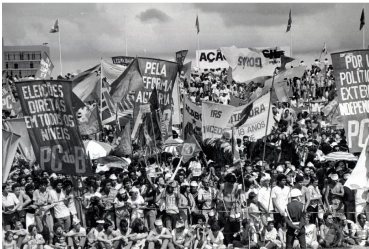
(Movimento Diretas Já)

Confira alguns dos acontecimentos nacionais que marcaram a época: