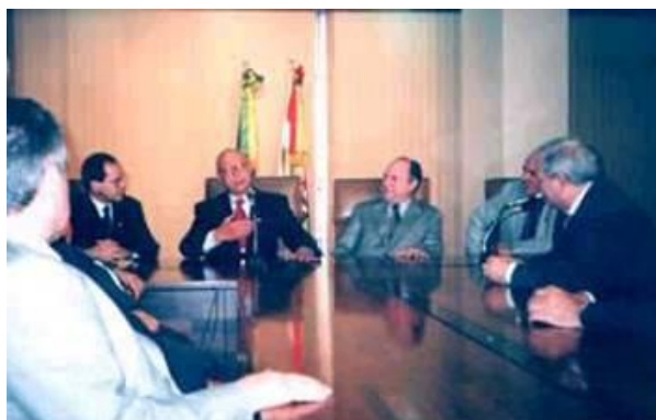
(Participação do Sindesesc no lançamento do SNG em São Paulo)

1997- Implantação do Sistema Nacional de Gravames - SNG: O SNG possibilita a efetivação eletrônica da inclusão ou baixa de gravames financeiros, eliminando o trâmite e exame de documentação em papel. Estabeleceu-se como sistema de alta segurança pela sua capacidade de impedir fraudes nos registros de gravames referentes aos contratos de Alienação Fiduciária, Arrendamento Mercantil ( Leasing ), Reserva de Domínio e Penhor de veículos (Fonte: Fenaseg).