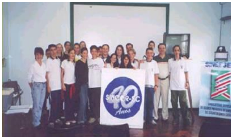
(Programa Cultura do Seguro nas Escolas)

1999 (09 de agosto) - Realização do processo eleitoral do quadro diretivo, Gestão 1999/2002. A posse se realizou no dia 1º de outubro, no Bela Vista Country Club, em Gaspar.